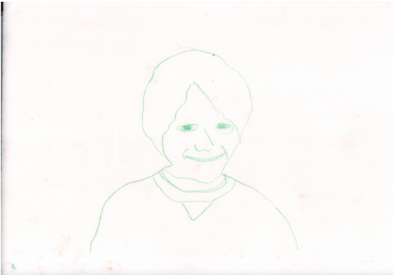
Photogramme de la séquence 1

Dans un premier temps, chaque élève sera pris en photo. Ces photos serviront de guide pour réaliser une première séquence d'animation à l'aide de calques (6 ou 12), permettant ainsi de créer un autoportrait animé. L'exercice consistera à reproduire la même image sur tous les calques. Bien que cela puisse sembler contre-intuitif, la répétition d'une même image génère du mouvement en raison de l'impossibilité pour le participant de reproduire exactement le même tracé à chaque fois. Ainsi, l'animation naît des variations dans le dessin et la forme. L'ensemble sera ensuite numérisé pour obtenir une première séquence animée.