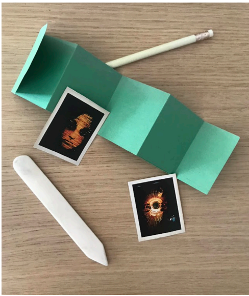
Réalisation de livre accordéon

Vocabulaire : sélectionner, découper, composition, superposer, coller, montage d'images, visages, scénographie, mise en espace, installation, sculpture, accrochage.