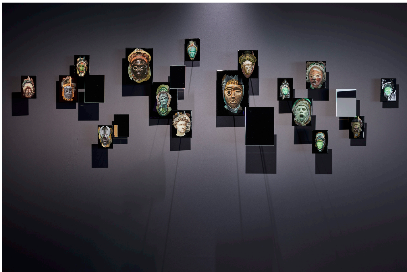
Nos visages comme la mue d'un même serpent , installation, 2023, Caroline Trucco. Installation composée de collages résinés et miroirs montés sur tiges métalliques. Vue de l'exposition Oui, mais des mots étendards, galerie contemporaine, Mamac, Nice, 2023.

À l'issue de ce processus, 3 installations collectives verront le jour, témoignant du passage du « je » au « nous » : un déplacement où les histoires individuelles se transforment, se répondent et composent un corps partagé. Cet atelier invite à créer ensemble une mue commune, un visage pluriel en mouvement.