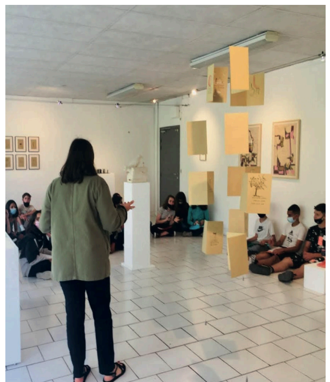
Exemple d'accrochage dans l'espace des livrets (suspension)